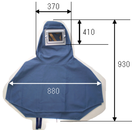
AS 型 大