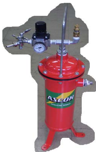
エアラインフィルター (オプション)